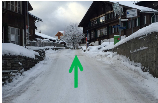
4 Nach ca. 200 m (auf dem Stein) fahren Sie weiter geradeaus.