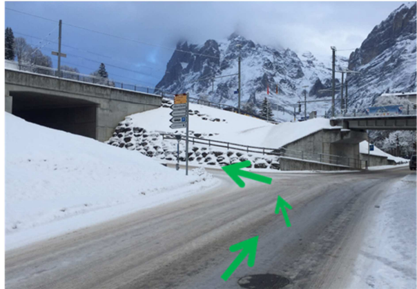
2 Hier links abbiegen und auf der Spillstattstrasse. Dieser Strasse ca. 1km folgen. (Tal auswärts)