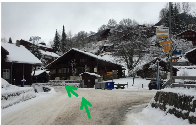
3 Tuftbach, fahren Sie weiter auf dieser Strasse. Vorbei am Hotel Eigerblick danach wird die Strasse steiler.