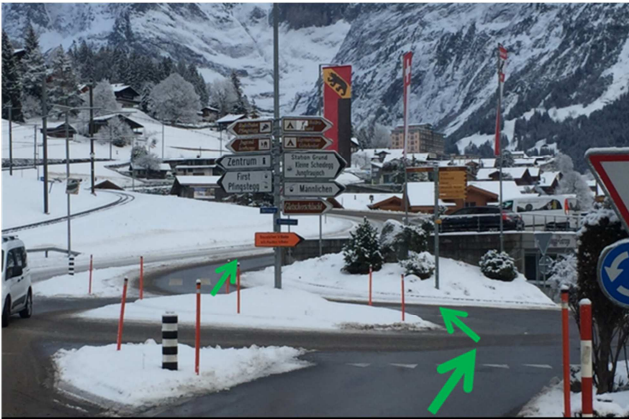
1 Beim Kreisverkehr die 2. Ausfahrt nehmen. ca. 1 km auf dieser Strasse weiterfahren.