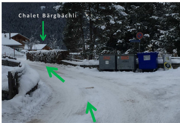
5 Auf dem Stutz angekommen fahren Sie noch ca. 100 m geradeaus.

Fahren Sie nicht Richtung Bachsbortweg- Herrschaftsweg.